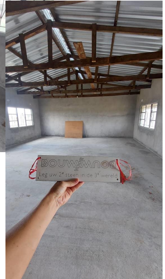
Collage 1: bouwproces klaslokaal 7 + eindresultaat